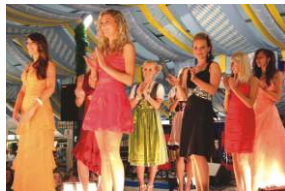
Kirchweih: Miss Mfr.-Wahl, 10.07., Ansbach