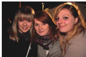
Mondscheinevent, 23.07., Aha