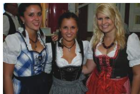
Volksfest, 08.07., Treuchtlingen