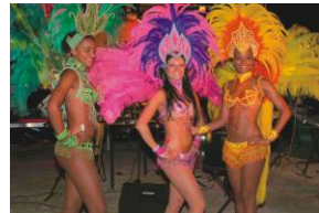
KariBIG Nacht, 16.07., Gunzenhausen