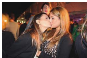
Beach Party, 23.07., Burgoberbach