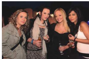
PS.de Summer Fever, 02.07., Absberg