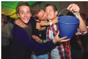
Beach Party, 23.07., Burgoberbach