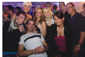
Beach Party, 23.07., Burgoberbach