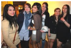
Kneipen Jagd, 09.04., Weißenburg