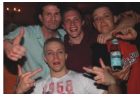
DJ Tonic live @ Salinas, 09.04., Weißenburg

friSeur pfuff DAMEN UND HERREN Krankenhausstraße 1 91719 Heidenheim Tel.: 09833/248 www.friseur-pfuff.de