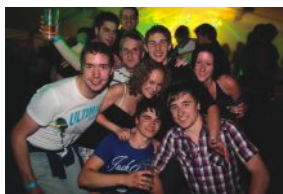
Mega Power Party, 24.04., Unterwurmloch