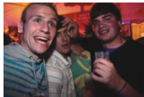
Mega Power Party, 24.04., Unterwurmloch