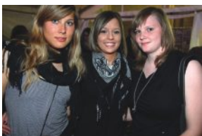
Mega Power Party, 24.04., Unterwurmloch