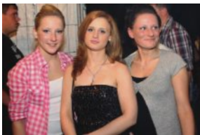
Funny Bunny Party, 16.04., Triesdorf