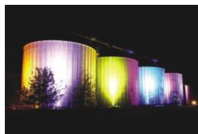
Mega Power Party, 24.04., Unterwurmloch