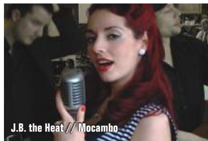
J.B. the Heat // Mocambo

Nicht zu vergessen ist die offizielle und legendäre Aftershowparty im Club Salinas - dort mit Dj Tonic und Dj Minusfreund. Alle Kneipen mit Bands findet Ihr hier im Heft auf Seite 2 oder auf www.kammer-events.de (TB)