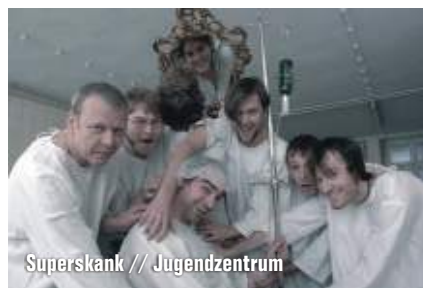
Superskank // Jugendzentrum