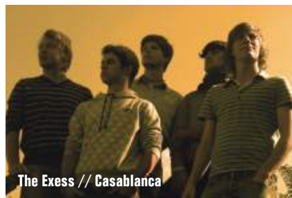
The Excess // Casablanca