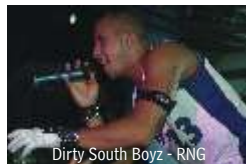
Dirty South Boyz - RNG