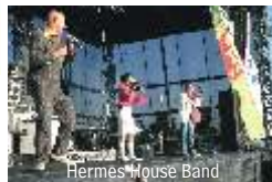
Hermes House Band